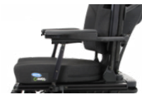
Ap. Braço Reclinável